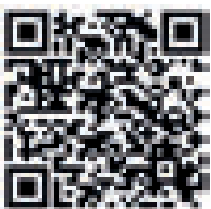
QR-Code Linie RE 9