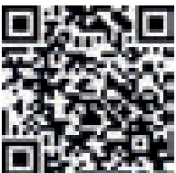
QR-Code Linie S 19