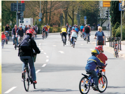
Freie Bahn für alle Altersgruppen

- Essen und Getränke, angeboten von Fleischer Kalender und dem Wittgensteiner Hof - Weinstand des Männergesangvereines Sterzhausen - Servicestand der Firma Zweirad Wießner (Tel.: 0172 6740451)