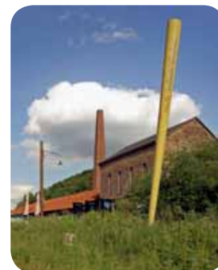
LWL-Industriemuseum – Zeche Nachtigall

Wer ins Muttental, der „Wiege des Ruhrgebietes“ kommt, kann die unter Denkmalschutz stehende Zeche Nachtigall besichtigen, deren Maschi-