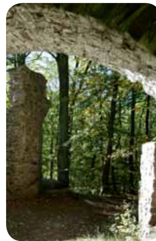
Burgruine Schwarzenberg, Plettenberg

dem kleinen Rundturm zum Garten sowie dem Sichern verschiedener Mauerstücke am Drosten- und Roisthaus.