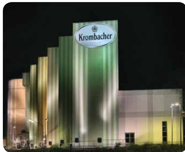
Krombacher Brauerei, Kreuztal