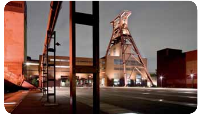
Zeche Zollverein, Essen