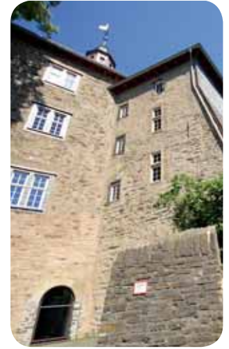
Oberes Schloss, Siegen

Bereits vor 1224 wurde auf dem Sieberg eine Burganlage errichtet. Seit dem 18. Jahrhundert wird sie als „Oberes Schloß“ bezeichnet. Das Obere Schloss liegt auf dem 307 Meter hohen Sieberg in der Stadt Siegen. Die Anlage geht auf eine mittel-