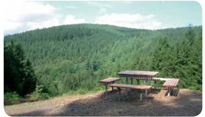
Rundwanderweg Littfequelle, Kirchhundem-Welschen Ennest