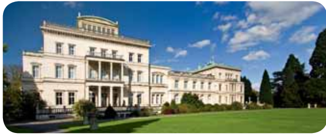
Villa Hügel, Essen