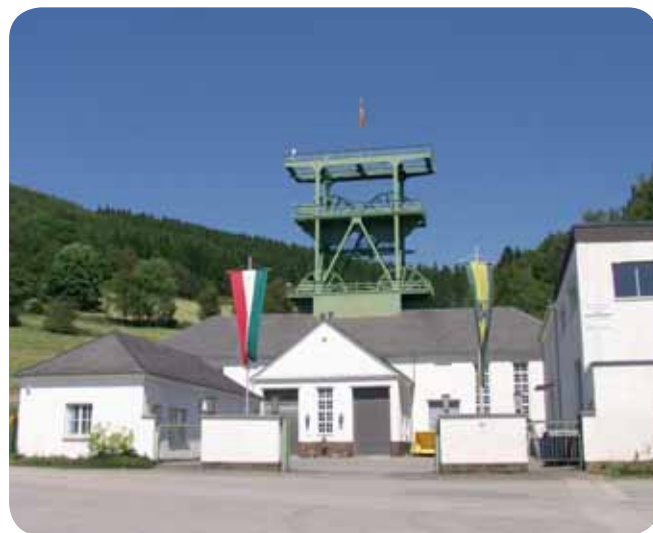
Bergbaudenkmal Siciliaschacht, Lennestadt-Meggen