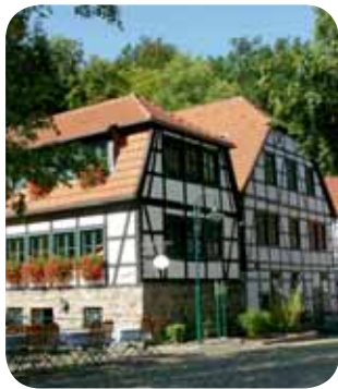
Historische Fabrikanlage Maste-Barendorf