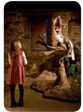
Museum für Ur- und Frühgeschichte im Wasserschloss Werdringen, Hagen

Das auf einer Anhöhe inmitten dichtbewachsenen Waldes oberhalb des Hagener Stadtteils Hohenlimburg gelegene Schloss ist die einzige noch weitgehend in der ursprünglichen Baugestalt erhaltene mittelalterliche Höhenburg in Westfalen.