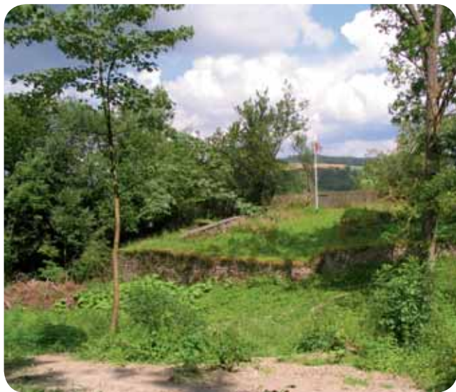
Burgruine Peperburg, Lennestadt

📍 Lennestadt-Grevenbrück oder Lennestadt-Borghausen